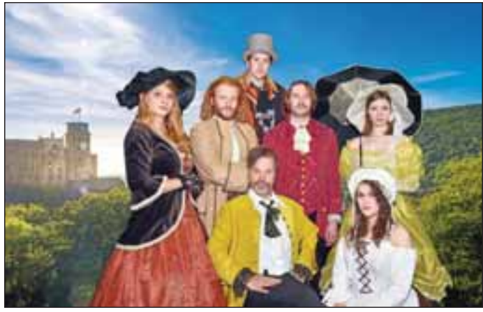
Das Historische Dinnertheater feiert seine Premiere am 5. März auf dem Schloss Heidelberg.

Historisches Dinnertheater im Heidelberger Schloss